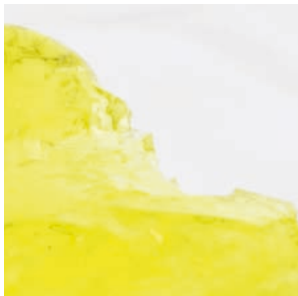
Monoï shower jelly.

Soin Séquentiel is another concept from this company – a multi-phase product created by sequences of active ingredients (see photo). This means that the active ingredients received by the skin are renewed over three sequences of ten days. The selected actives (oligoéléments, anti-oxydants, organic plant extracts, etc.) are delivered by means of the Micromatrix technology. These microparticles allow ingredients to be encapsulated, transported and diffused within the target tissue.