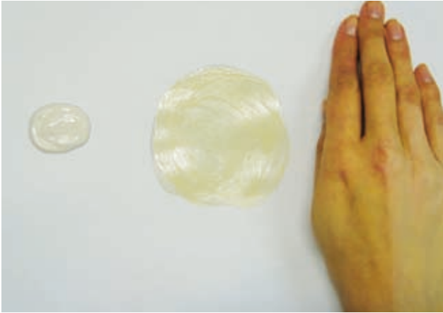
1000 minutes de SPF.